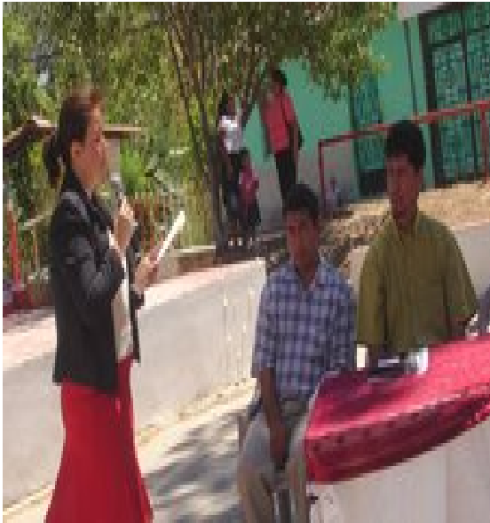
Lectura de Convenio de Cooperación entre El Movimiento salvadoreño de Mujeres y Alcaldía Municipal de Tapalhuaca.