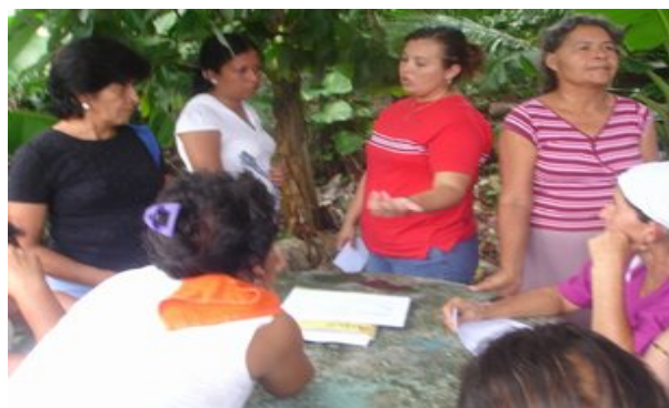
Mesas de trabajo con mujeres de diferentes comunidades de Tapalhuaca.

incorporar la igualdad de género a la gestión municipal