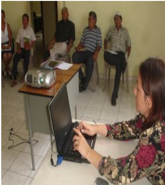
Socialización de PIG con Concejo Municipal de Tapalhuaca