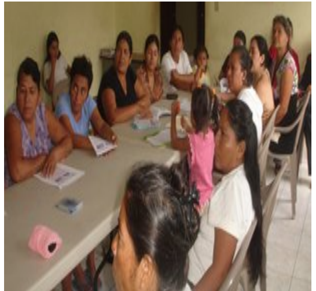
Desarrollo de talleres con Mujeres de Diferentes comunidades del Municipio de Tapalhuaca