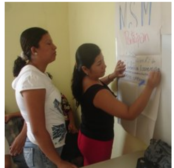
Mujeres participando en talleres para la Formulación de la PIG