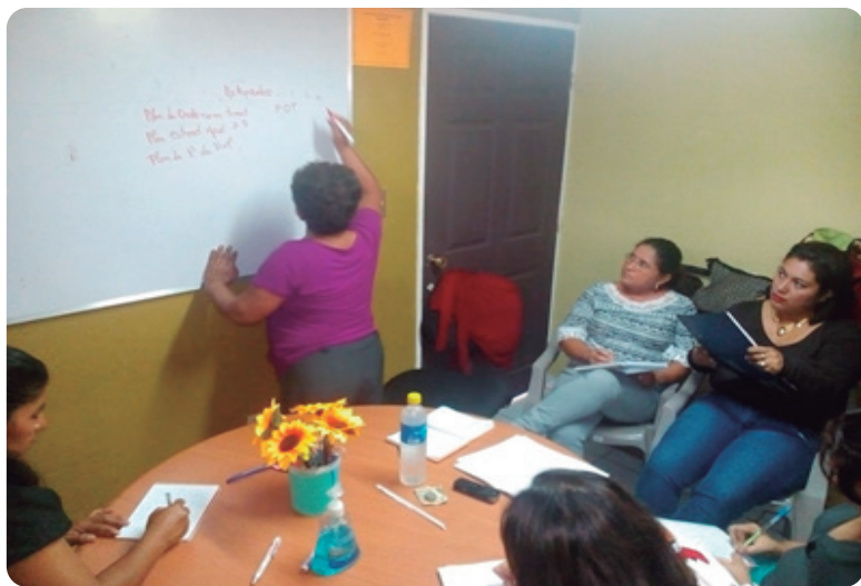
Unidad de la mujer.