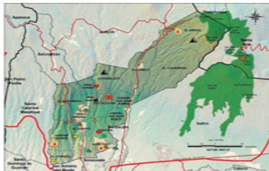
Mapa 1. Ubicación geográfica

Situado a 74 Km. de San Salvador, el municipio se divide en 15 cantones y 43 caseríos; su acceso es por una carretera en buenas condiciones; la “ruta de las flores” que comprende varios municipios de esta región, comienza su recorrido en Nahuizalco.