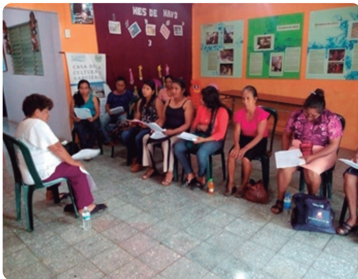
Taller a encuestadoras de Diagnostico.