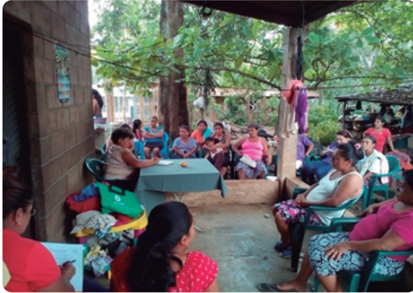
Cantón Sabana Grande.