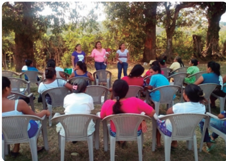
Cantón Anal Arriba.